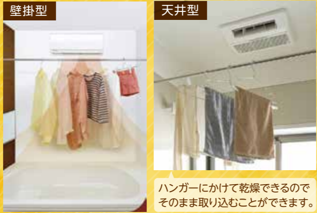
ハンガーにかけて乾燥できるのでそのまま取り込むことができます。

浴室での乾燥機能は衣類の乾燥だけでなく、浴室の壁や浴槽、パッキン部分などのカビを軽減することにも繋がります